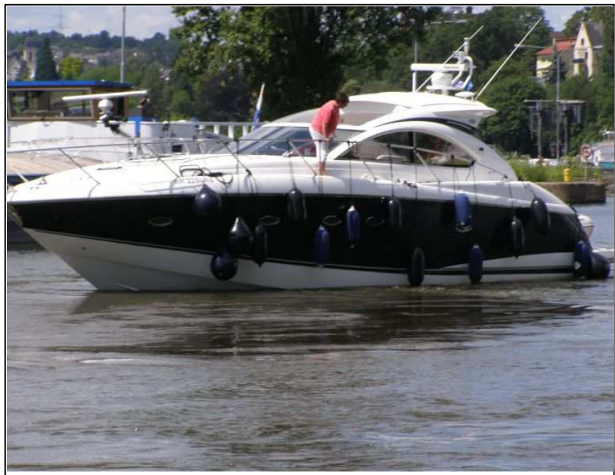
Ilka, Cem und Peter

Und immer schön die Fender raushängen!!!